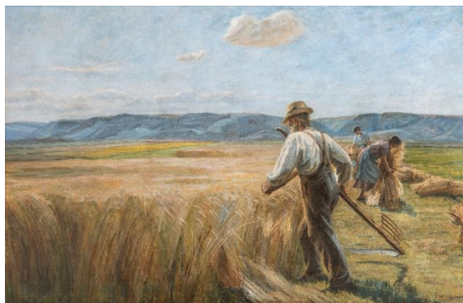
Johannes Wilhjelm: Høstfolk . 1927. Fuglsang Kunstmuseum.

Med afsæt i 1800-tallets traditionelle kunst og det moderne friluftsmaleri vedblev Johannes Wilhjelm at afprøve nye måder at male på. Han fortsatte også med at rejse og boede bl.a. i 1920'ernes Sydfrankrig.