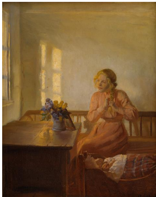
Anna Ancher: Interiør med en ung pige, der fletter sit hår. 1901. Tilhører SMK.