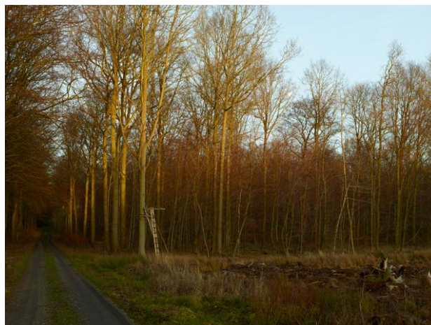
Torben Eskerod: Landskab , Korselitse Østerskov, Falster 2012

De har ladet sig inspirere af stedernes historier, mennesker, landskaber og byer og derigennem skabt en stilfærdig hyldest til de potentialer, yderområderne også rummer; landskabeligt, æstetisk og menneskeligt.