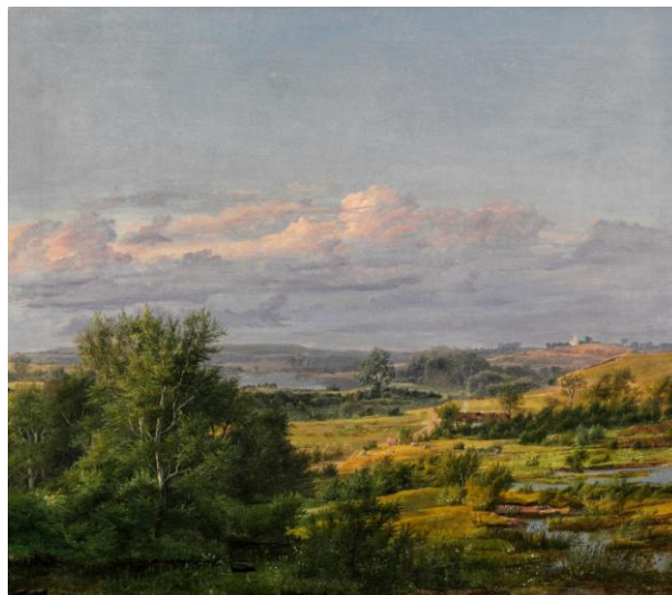
Dankvart Dreyer: Fynsk landskab , 1838-39.

I efteråret 2012 lykkedes det museet at erhverve et