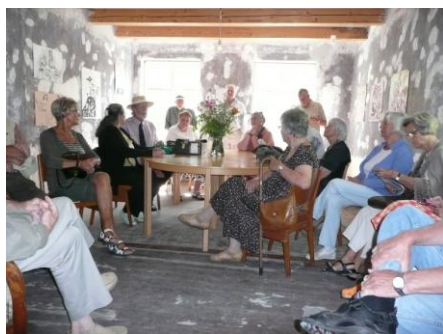
Venneforeningen havde i august et arrangement i Richard Winthers Hus i Vindeby.

Venneforeningen vil have en stand, hvor du kan komme af med ris og ros samt høre om foreningens tilbud herunder om at være aktiv vennehjælp.